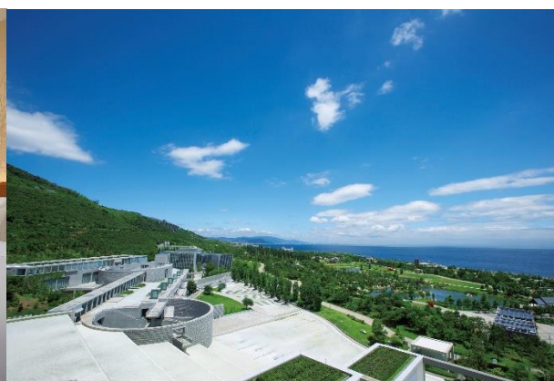
パノラミックビューからの眺め