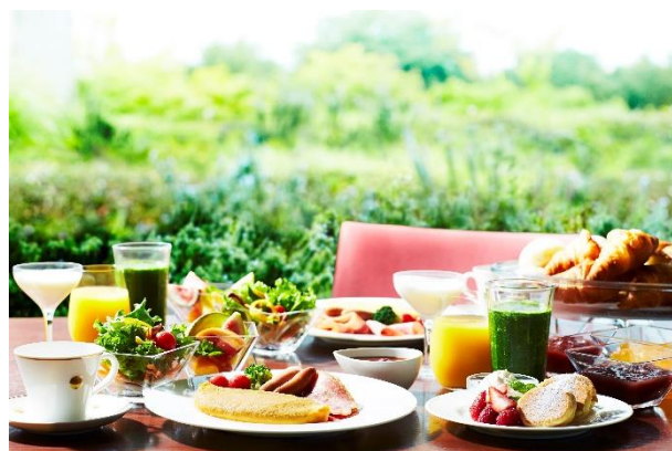
ファンダイニング「コッコラーレ」朝食イメージ