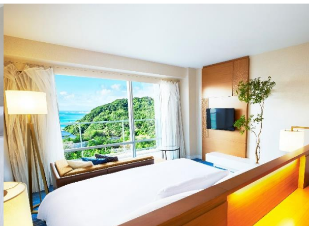
「プレシャスフロア」デラックスルーム