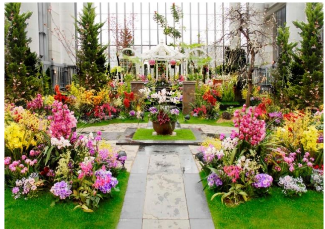
「奇跡の星の植物館」 淡路夢舞台ラン展 2021 イメージ

建築家・安藤忠雄氏グランドデザインによる淡路夢舞台の施設群の一つ、「奇跡の星の植物館」は、高さ17m、幅24m、長さ100mの巨大な立方体がクロスした建物が特徴的で、約3千種3万株もの多様な植物の展示や、人と自然をテーマに魅力あふれるフラワーショーが開催されています。その中でも2021年1月23日(土)より開催される「淡路夢舞台ラン展 2021」は、西日本最大規模のラン展で、地球に生き残るためのランの美しく、芳しく、驚きの戦略を五感で体感できる展示や、サル顔のランなど千種を超える希少種コレクションが登場します。