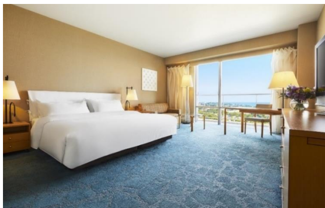
ラグジュアリールーム