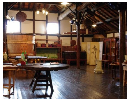
千年一酒造 酒蔵見学イメージ

古くから大阪・京都で珍重されてきた夏の美味「淡路の鱧」や島名産の玉葱など、淡路の食材を贅沢に盛り込んだ日本料理「あわみ」の地産地消会席と、地元の土と水で栽培した酒米のみを使用する酒造りに挑戦し続ける、明治八年創業の老舗酒蔵「千年一酒造」にて酒造りの見学や利き酒体験をお楽しみいただけます。