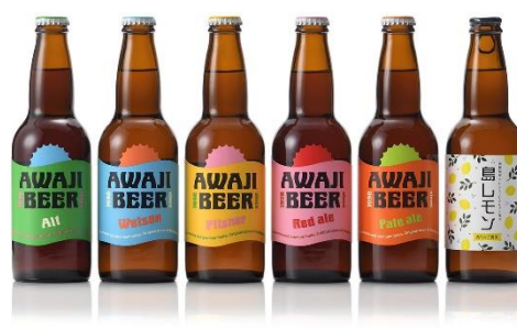
クラフトビール「あわぢびーる」